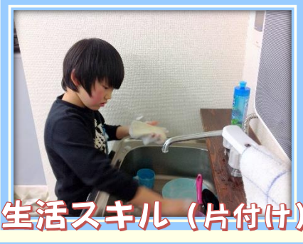
生活スキル (片付け)